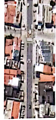
FOTO AEREA DO LOCAL DO TERRENO